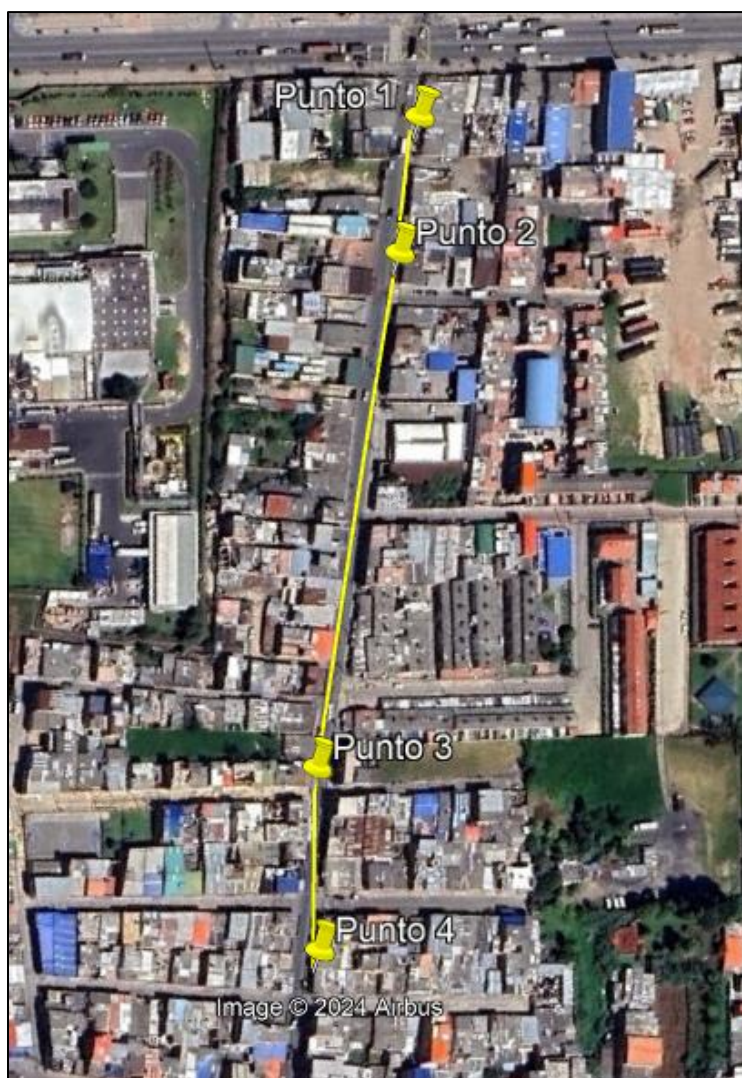
Ilustración 1. Recorrido verificación ambiental

Con base en lo anterior, el día 16 de septiembre de 2024 se realizó recorrido de control y vigilancia en el barrio Serrezuelita desde las coordenadas 4°42'42,816"N- 74°12'38,995"W hasta las coordenadas 4°42'32,564"N- 74°12'34,474"W (ver ilustración 1. Ruta amarilla).